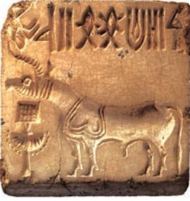
एक हड़प्पाई मुहर

भारत के अतीत की सबसे पहली तस्वीर उस सिंधु घाटी सभ्यता में मिलती है, जिसके अवशेष सिंध में मोहनजोदड़ो और पश्चिमी पंजाब में हड़प्पा में मिले हैं। इन खुदाइयों ने प्राचीन इतिहास की समझ में क्रांति ला दी है।