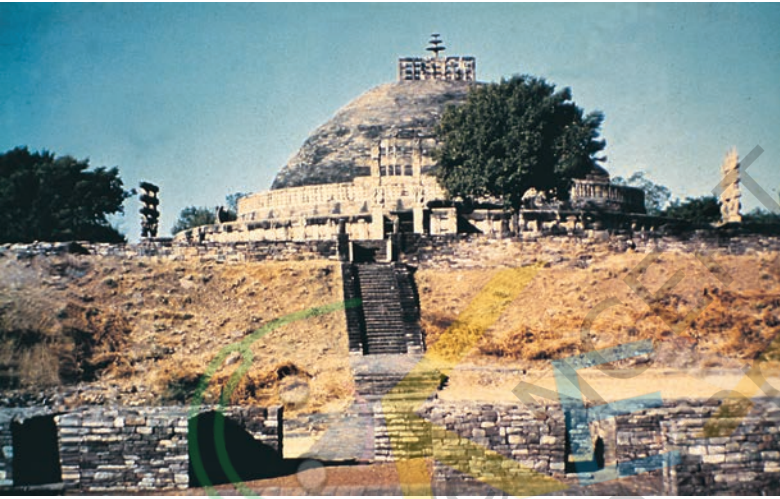
अशोक के समय में निर्मित साँची का स्तूप

इस अद्भुत शासक ने, जिसे आज भी भारत और एशिया के बहुत से दूसरे भागों में प्यार से याद किया जाता है, अपने आपको बुद्ध की शिक्षा के प्रचार में, नेकी और सद्भाव के काम में तथा प्रजा के हित के लिए सार्वजनिक कार्यों के प्रति समर्पित कर दिया। उसने ऐलान कर दिया था कि वह इनके लिए हमेशा तैयार है। हर स्थान पर और हर समय, सरकारी कर्मचारी जनता के कार्यों के बारे में उसे बराबर सूचना देते रहें, चाहे जिस समय और जहाँ भी हो वह लोक-हित के लिए अवश्य काम करेगा।