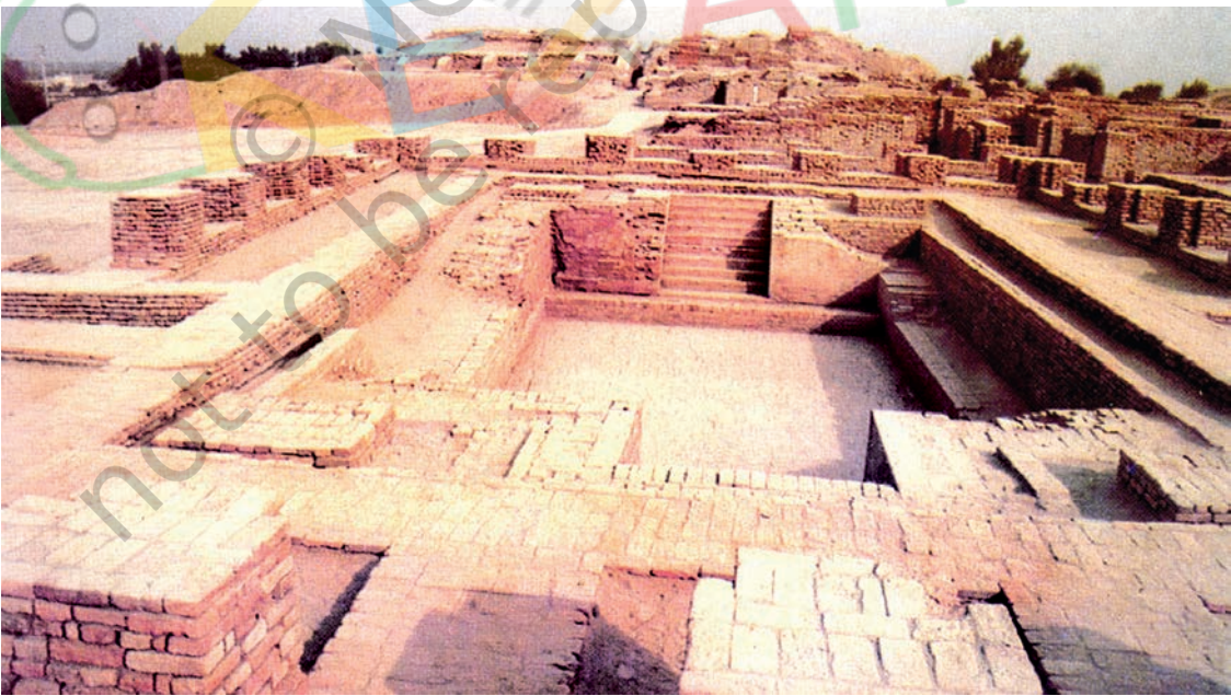
मोहनजोदड़ो का महान स्नानागार

सिंधु घाटी सभ्यता और वर्तमान भारत के बीच समय के ऐसे कई दौर गुज़रे हैं जिनके बारे में हम बहुत कम जानते हैं। वैसे भी इस बीच असंख्य परिवर्तन हुए हैं। लेकिन भीतर ही भीतर निरंतरता की ऐसी शृंखला चली आ रही है जो आधुनिक भारत को छः-सात हज़ार पुराने उस बीते हुए युग से जोड़ती है जब संभवतः सिंधु घाटी सभ्यता की शुरुआत हुई थी। यह देखकर अचरज होता है कि मोहनजोदड़ो और हड़प्पा में कितना कुछ ऐसा है जो हमें